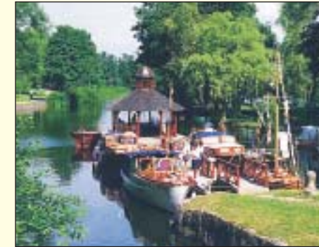
Tannefors slussar, Kinda kanal