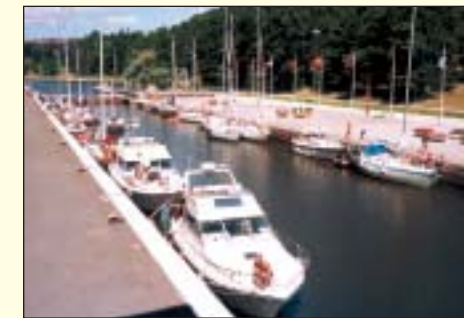
Slussen, Södertälje kanal