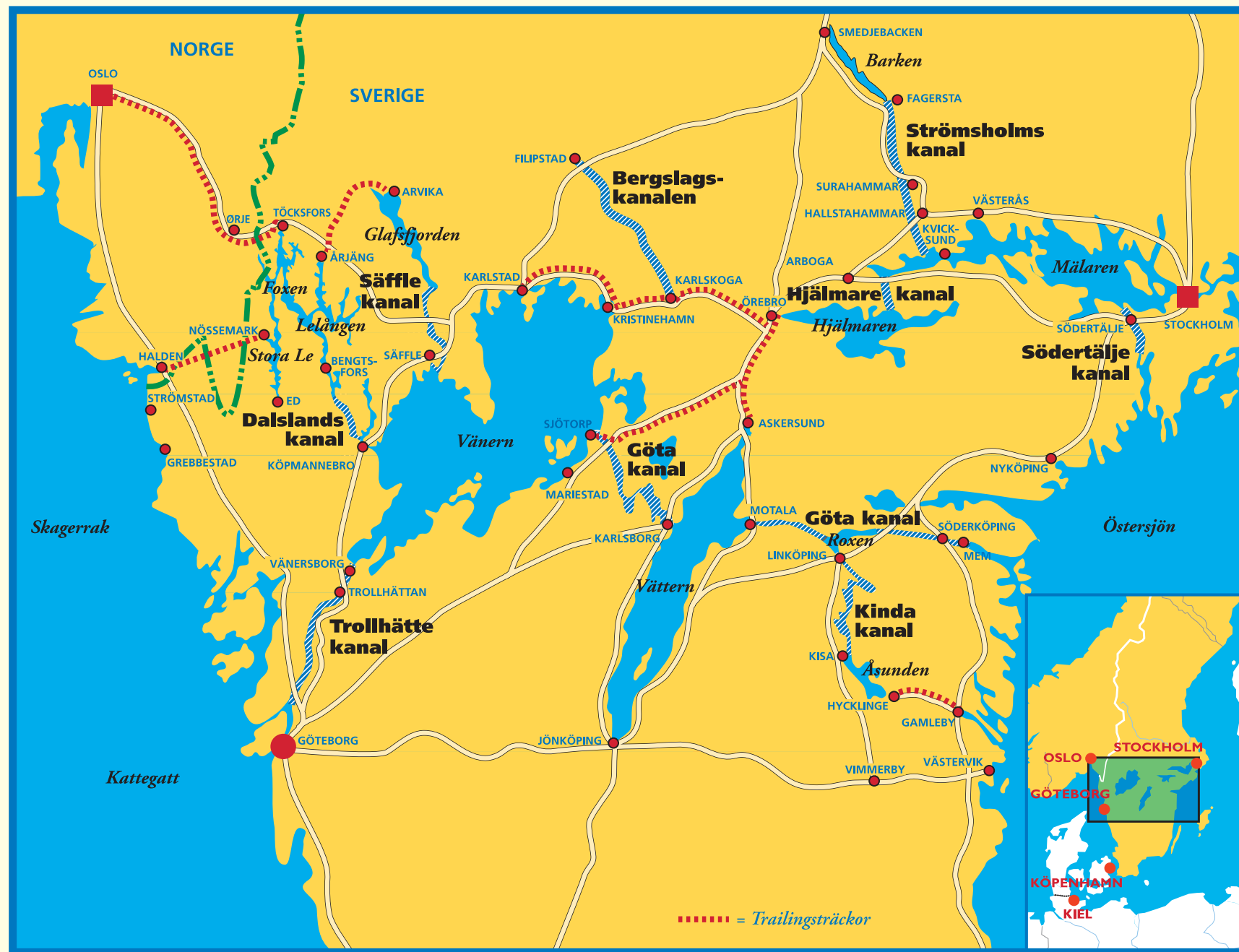
KARTA: VADSTENA INFO / Owe Örnstahl 1998

Världskonferens för kanaler till Sverige år 2005 Arrangör: Föreningen Sveriges kanaler Information: www.sverigeskanaler.com