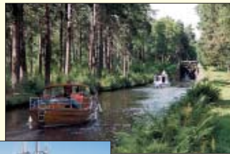
Trångfors, Strömsholms kanal