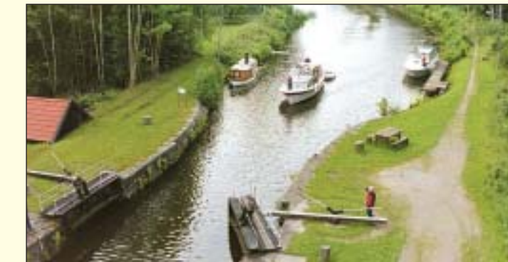
Åttans sluss, Hjälmare kanal.

BERGSLAGSKANALEN Bjurbäckens slussar Eldriven båt för dagsutflykter Tel. 0550-630 26. www.bergslagskanal.se Stensviken Hyrbåtar KB Bjurtjärn, Stensviken 1, 688 92 STORFORS Tel. 0550-320 58