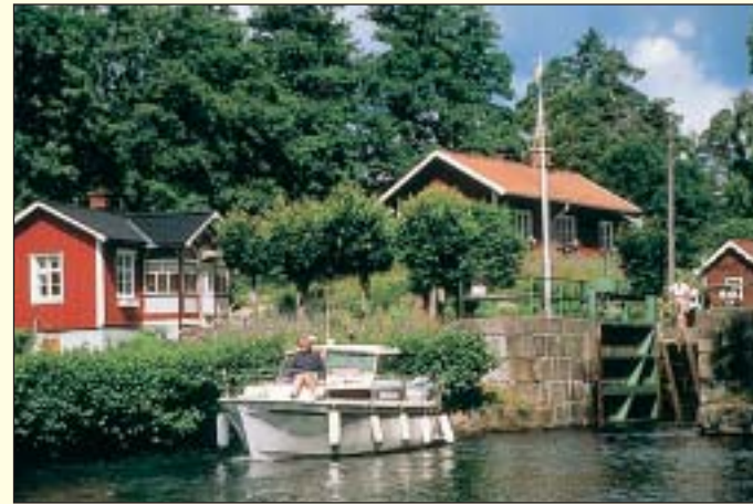
18:e slussen, Dalslands kanal

Sveriges kanaler bjuder på sköna naturupplevelser, härliga äventyr och upptäckarglädje i unik, kulturhistorisk miljö. Kanalerna erbjuder trygghet, aktiviteter och modern service för såväl vuxna som barn. Ingen kanal är den andra lik. Med båttrailing mellan de stora sjösystemen ges många möjligheter att variera båtfärden och njuta av de många spännande kanalerna i vattenlandet mitt i Sverige!