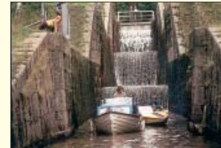
Bjurbäckens slussar Bergslagskanalen