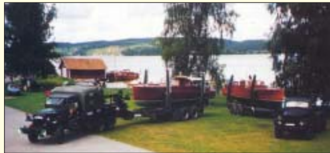
Båttransport Hycklinge - Gamleby, Kinda kanal.

Lift your boat between the lakes Für Boottransporte zwischen den Seen