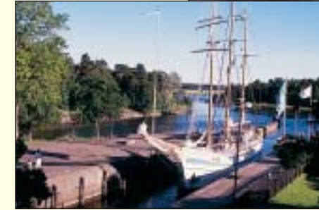
Säffle kanal, Säffle