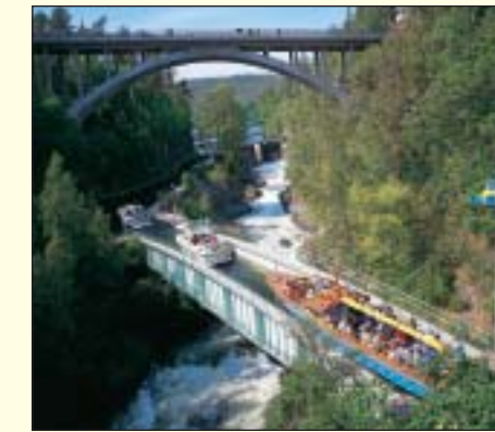
Akvedukten i Håverud, Dalslands Kanal

Utgiven av Föreningen Sveriges Kanaler 2003. www.sverigeskanaler.com Omslagsbild: Borensbergs sluss, Göta kanal.