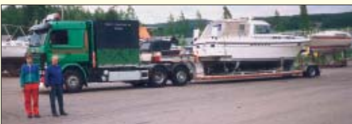
Båttransport mellan Hjälmarén - Vänern - Vättern

Dalslands kanal - Vänern - Trollhätte kanal - Västkusten Landtransport: Nössemark Båttransport Tel. 0534-301 18, 070-522 17 93