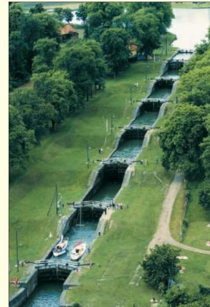
Bergs slussar Göta kanal